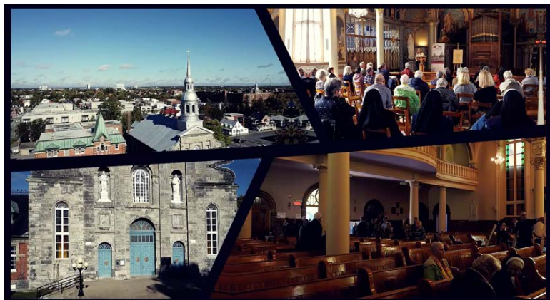
Image provenant de la vidéo documentaire de la chaire dans le cadre de l'événement du Cultuel au Culturel 2025 organisé par la Ville de Saint-Hyacinthe.

Le colloque vise à stimuler une réflexion collective et à faire émerger des solutions durables , en réunissant des voix issues du milieu universitaire, du secteur public, d'organismes communautaires et des domaines de l'architecture, de la culture et du développement territorial.