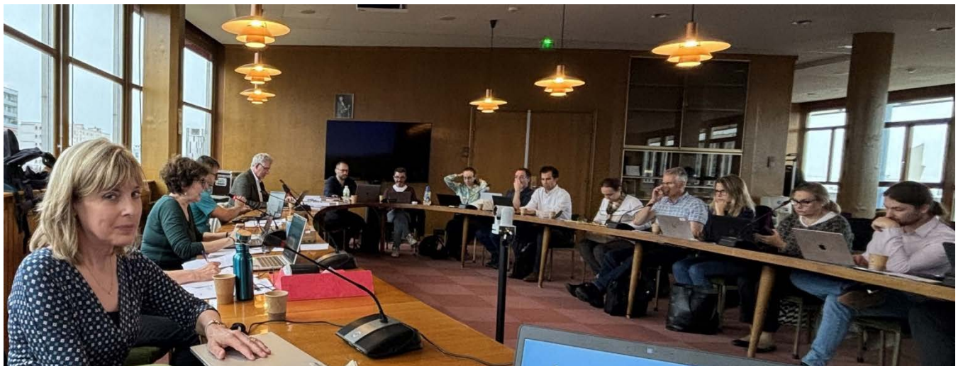
La titulaire lors de la séance de réflexion des correspondants européens et canadien d'EUREL en septembre 2024, sur la liberté d'expression, à Strasbourg.